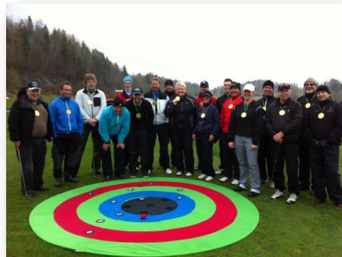
Trener 1, Haugaland GK