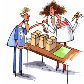
Valg av utstyr