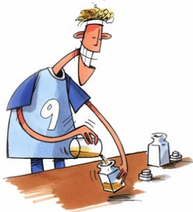
A- og B prøve